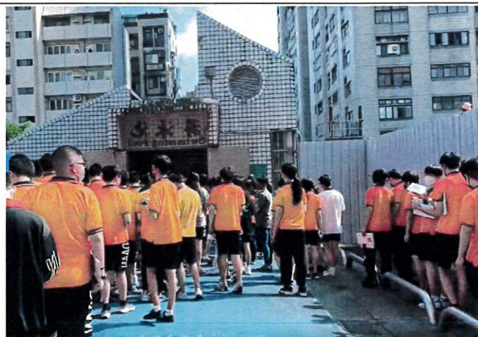
至防空避難所避難