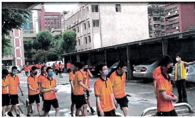
地震避難疏散引導