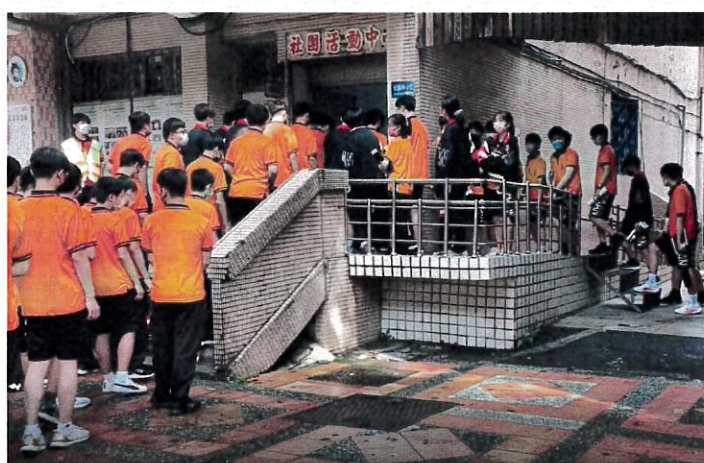
至防空避難所避難