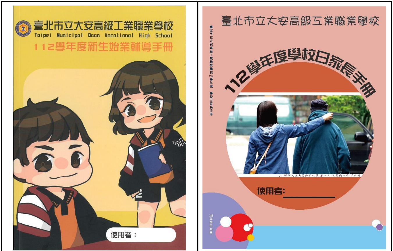
於新生始業輔導及學校日活動宣導