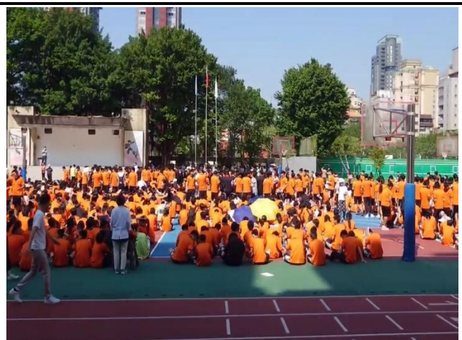
配合防災避震演練宣導「家庭防災卡」及「行動防災 App」