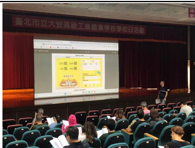
利用學校日推廣「家庭防災卡」