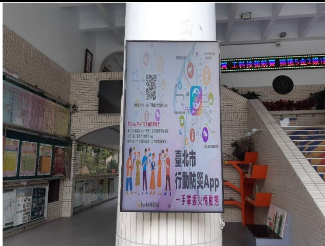
利用學校日於川堂播放「行動防災 App」宣導