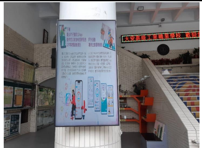
利用學校日於川堂播放「行動防災 App」宣導