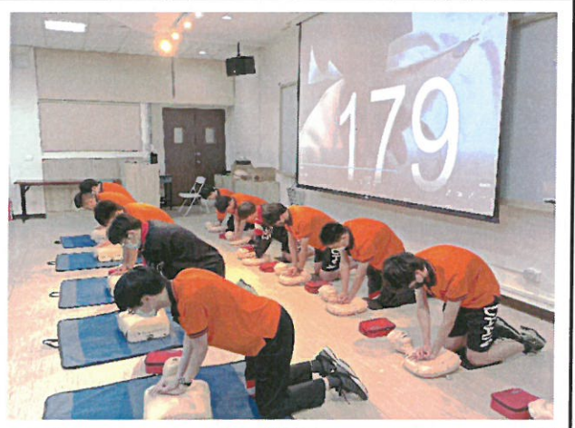
心肺復甦術實作訓練