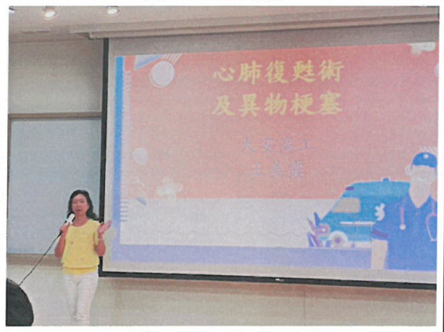
心肺復甦術及異物梗塞教學