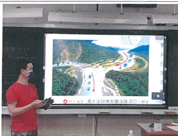
崩塌、土石流自然災害教學