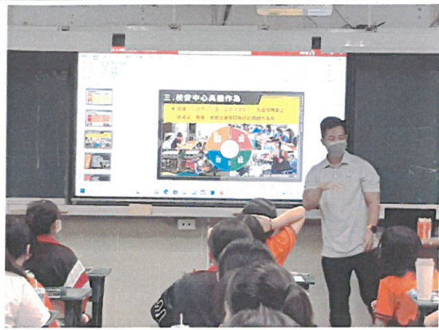
校園災害應變作為