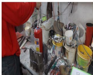
滅火器性能換藥施工中