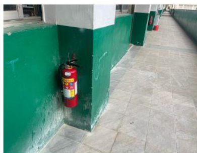
滅火器性能換藥完成放置回現場-1