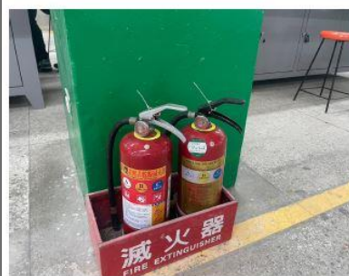
滅火器性能換藥完成放置回現場-2