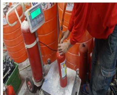
滅火器性能換藥劑充填施工中