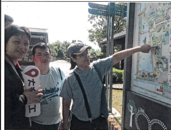
環境教育：認識林業及環境的重要性