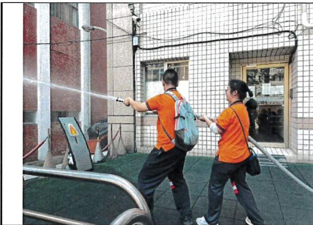
防災課程：防災觀念推廣—滅火體驗