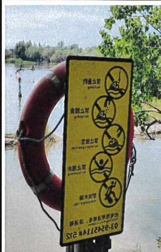
環境教育：認識環境安全標示