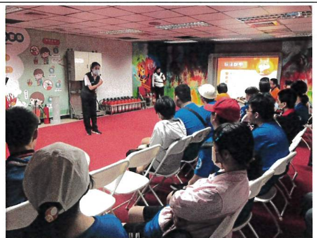
防災課程：防災觀念推廣—火災煙霧逃脫說明