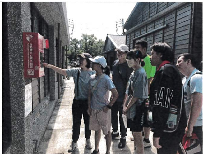
結合防災教育：尋找 AED 活動