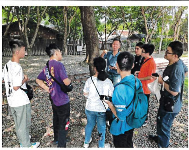
環境教育：生態教育