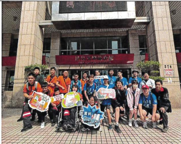
參訪防災科學教育館