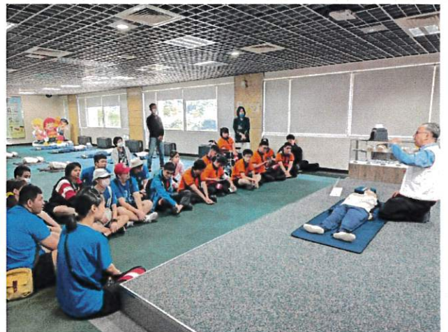
防災課程：防災觀念推廣—急救 CPR