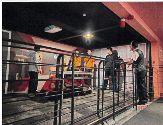
防災課程：防災觀念推廣—地震體驗